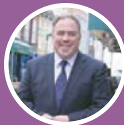
Джейсон Перрі, Муніципальний голова Кройдона

Якщо вам потрібно з кимось поговорити у раді, зателефонуйте за номером: 020 8726 6000 , Лінії працюють з понеділка по п'ятницю з 9:00 до 16:00